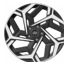
Unikátní N Line 18" kola z lehké slitiny