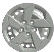
16" ocelová kola s celoplošnými kryty