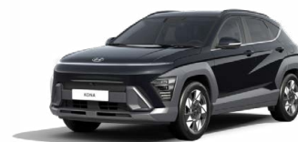
Abyss Black Pearl Perleťová Cena: 17 900 Kč