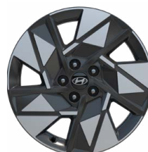
18" kola z lehké slitiny