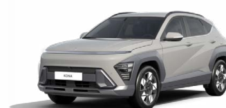
Quantum Grey Pearl Metalická Kombinace dostupná také s černým lakováním střechy Cena: 17 900 Kč