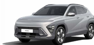
Shimmering Silver Metallic Metalická Kombinace dostupná také s černým lakováním střechy Cena: 17 900 Kč