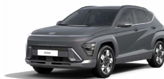
Ecotronic Gray Pearl Perleťová Kombinace dostupná také s černým lakováním střechy Cena: 17 900 Kč