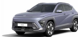
Meta Blue Pearl Perleťová Kombinace dostupná také s černým lakováním střechy Cena: 17 900 Kč