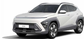
Serenity White Pearl Perleťová Kombinace dostupná také s černým lakováním střechy Cena: 17 900 Kč