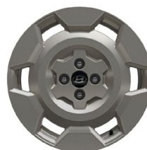
17" kola z lehké slitiny Cross

www.porovnejhyundai.cz (Porovnejte si vozy Hyundai s konkurencí)