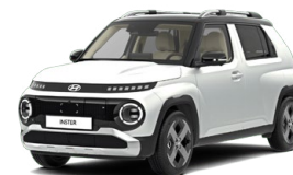
Aero Silver Matte