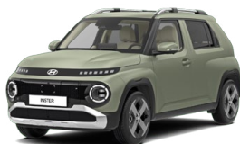
Bijarim Khaki Matte