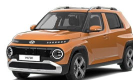
Sienna Orange Metallic

Kombinace dostupná také s černým lakováním střechy