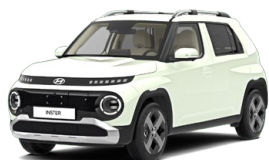
Unbleached Ivory Patelová