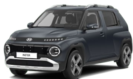
Dusk Blue Matte

Kombinace dostupná také s černým lakováním střechy