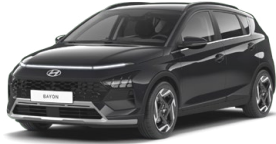
Aurora Gray Pearl Perleťová Cena: 13 900 Kč