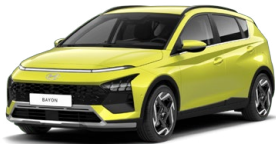
Lucid Lime Metallic Metalická Kombinace s černým lakováním střechy Cena: 13 900 Kč