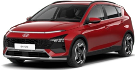
Dragon Red Pearl Perleťová Kombinace s černým lakováním střechy Cena: 13 900 Kč