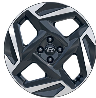
17" kola z lehké slitiny

www.porovnejhyundai.cz (Porovnejte si vozy Hyundai s konkurencí)