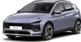
Meta Blue Pearl Metalická Kombinace s černým lakováním střechy Cena: 13 900 Kč