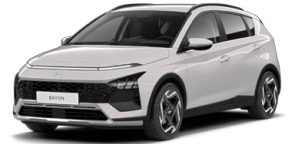
Lumen Gray Pearl Perleťová Kombinace s černým lakováním střechy Cena: 13 900 Kč