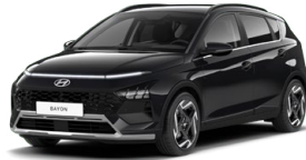
Phantom Black Pearl Perleťová Cena: 13 900 Kč