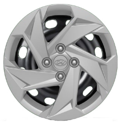
15" ocelová kola s celoplošnými kryty