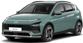
Mangroove Green Pearl Perleťová Kombinace s černým lakováním střechy Cena: 0 Kč