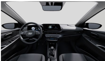
Černý Obsidian Black interiér - černé čalounění sedadel - světlé čalounění stropu a obložení bočních sloupků - černé provedení přístrojové desky a středové konzoly - černé provedení výplní dveří