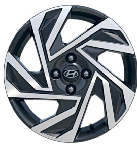
16" kola z lehké slitiny