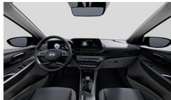
Černo-šedý Shale Gray interiér - černé čalounění sedadel s šedým prošíváním - světlé čalounění stropu a obložení bočních sloupků - světle šedé provedení spodní části přístrojové desky včetně středové konzoly - světle šedá spodní část výplní dveří