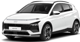
Atlas White Speciální pastelová Kombinace s černým lakováním střechy Cena: 5 000 Kč