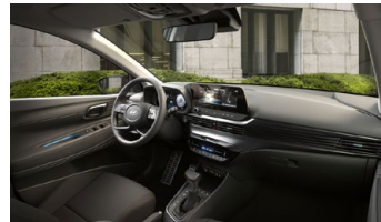
Černý s modrými akcenty - černé čalounění sedadel s modrým prošíváním - světlé čalounění stropu a obložení bočních sloupků - černé provedení přístrojové desky a středové konzoly - černé provedení výplní dveří s modrými akcenty