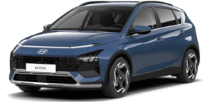
Vibrant Blue Pearl Perleťová Kombinace s černým lakováním střechy Cena: 13 900 Kč